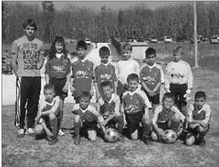
L'équipe des poussins 2008/2009 au complet