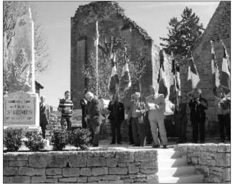
Au monument aux Morts