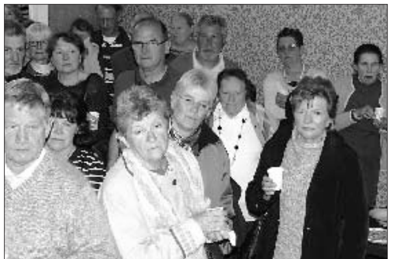
Le Club de loisirs a fait la fête