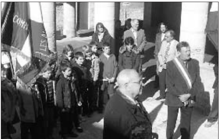
Les enfants parmi les grands et les anciens combattants