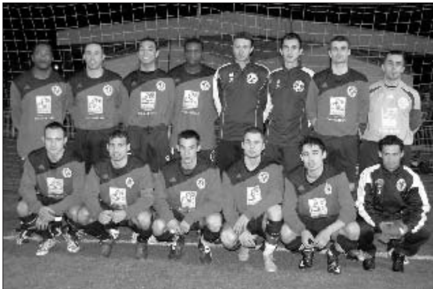
L'équipe seniors A