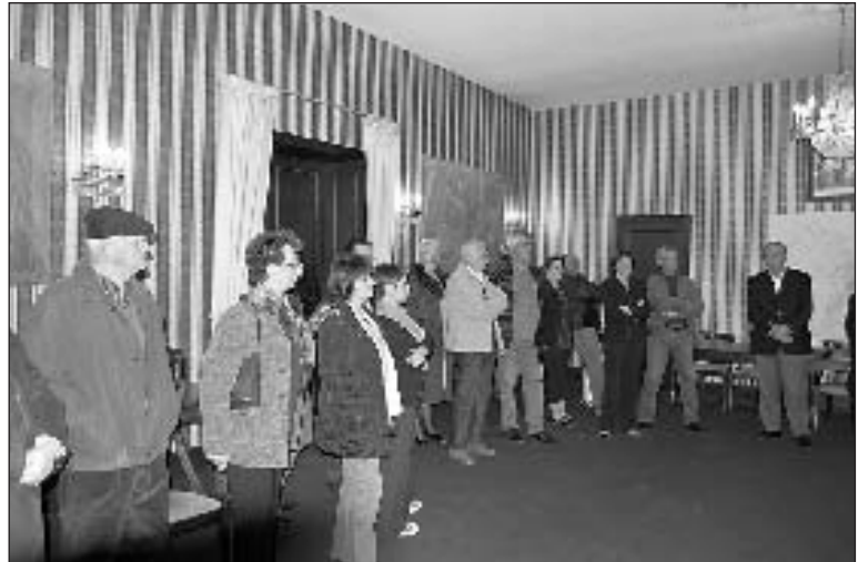
Une vingtaine de foyers ont répondu à l'invitation