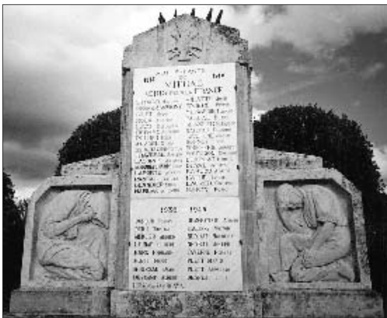
Le monument aux Morts de Vitrac

Le comité sarladais tiendra son assemblée générale annuelle le dimanche 5 avril à Vitrac, dans la salle de réunion de la mairie.